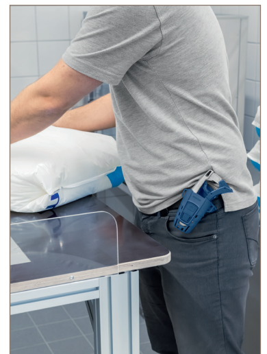
Travail facilité : les deux mains sont libres et le couteau est rangé en toute sécurité.

Pour vider les sacs qui viennent d'être découpés, l'utilisateur a besoin de ses deux mains. Ce qui veut dire : le couteau dans l'étui. Grâce au verrouillage, le SECUNORM 610 XDR est absolument sûr. Mais même déverrouillé, le couteau rentre parfaitement dans l'étui – et peut être retiré immédiatement et rapidement.